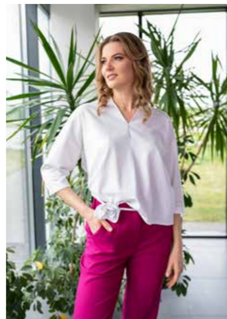
Bluzka LATTI i ELIF1 z pewnością staną się nieodłącznym elementem Twojej letniej garderoby.