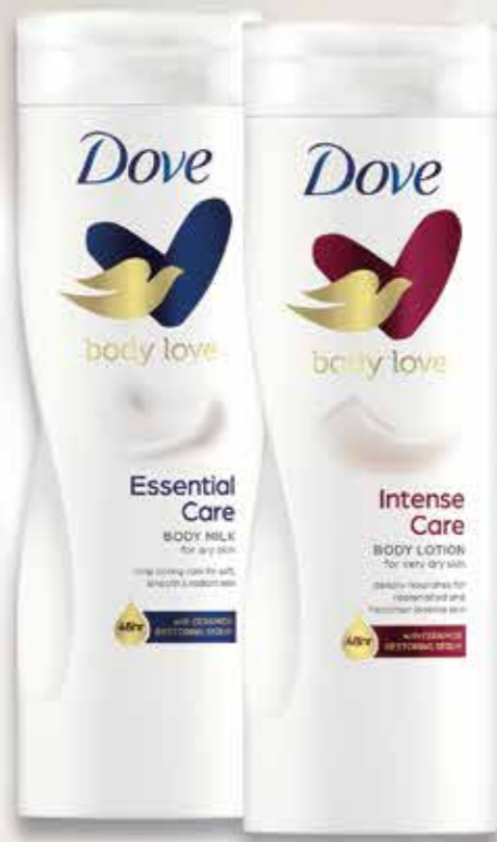
DOVE Balsam do ciała 400 ml, różne rodzaje