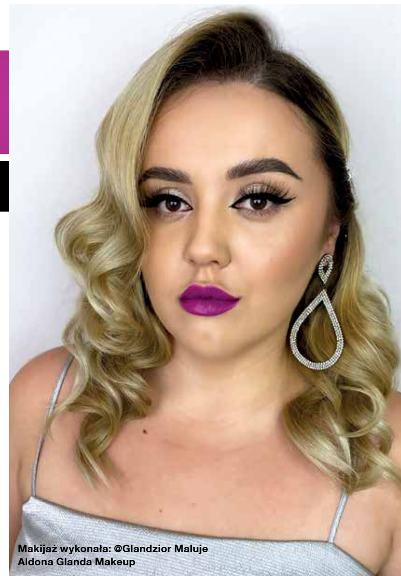
Makijaż wykonała: @Glandzior Maluje Aldona Glanda Makeup

Stylistka fryzur to osoba, która potrafi słuchać i szczerze doradzi nam tak, abyśmy - nie rezygnując z wygody - czuły się wyjątkowo.