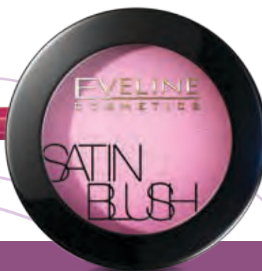
MODELUJĄCY RÓŻ DO PO- LICZKÓW SATIN BLUSH EVELINE COSMETICS CENA: ok. 18,00 zł