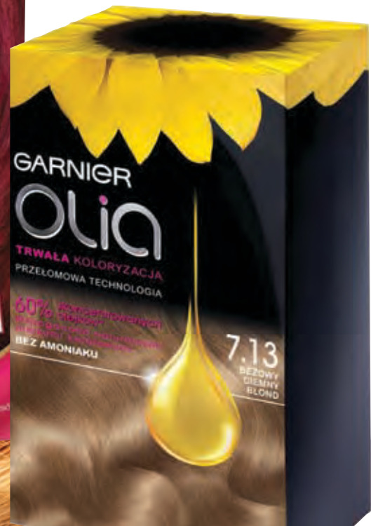
Olia Beżowy ciemny blond GARNIER