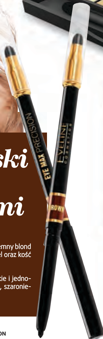
KREDKA AUTOMATYCZNA Z GĄBKĄ EYE MAX PRECISION EVELINE COSMETICS CENA: ok. 13,00 zł