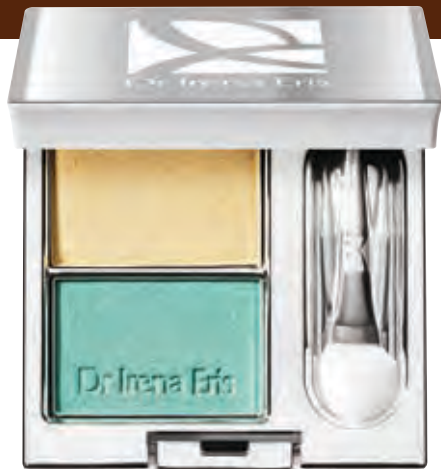
Cienie podwójne TWO EYESHADOWS COLLECTION - caribbean sea spirit N° 251 DR IRENA ERIS CENA: ok. 55,00 zł

UWAGA: Ciemne blondynki powinny unikać beżów przy twarzy, a brązowookie i jednocześnie brązowowłose panie powinny wystrzegać się czystego niebieskiego, szaroniebieskiego, popielatego i odcieni morskich!