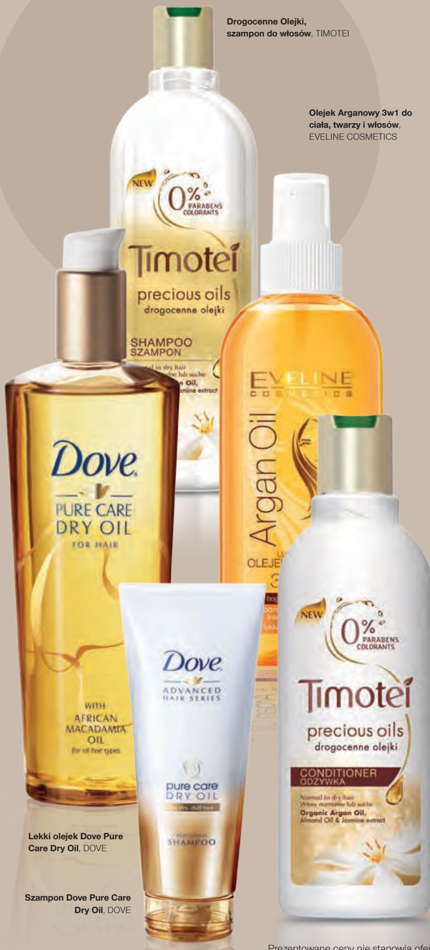
Lekki olejek Dove Pure Care Dry Oil, DOVE

Olejek Arganowy 3w1 do ciała, twarzy i włosów, EVELINE COSMETICS