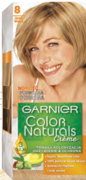
Farba do włosów Color Naturals 8 Jasny Blond, GARNIER Pierwszy odżywczy krem koloryzujący zapewniający podwójną ochronę: dla jedwabiście miękkich i lśniących włosów oraz dla bogatego i długotrwałego koloru.