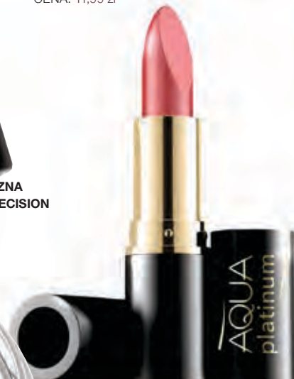
Pomadka Aqua Platinum EVELINE COSMETICS CENA: ok. 10,50 zł