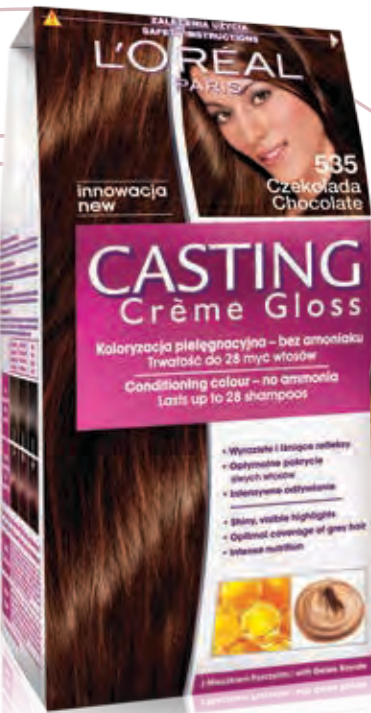
Farba do włosów Casting Crème Gloss 535 Czekolada CASTING CRÈME GLOSS Koloryzacja pielęgnacyjna bez amoniaku. Intensywne odżywienie z mleczkiem pszczołim. Smakowity, lśniący kolor. Subtelna zmiana.