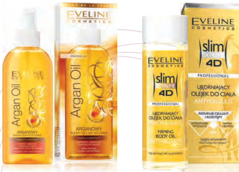
Arganowy suchy olejek do ciała EVELINE COSMETICS CENA: 22,00 zł