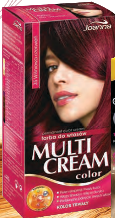
Farba do włosów Multi cream color JOANNA