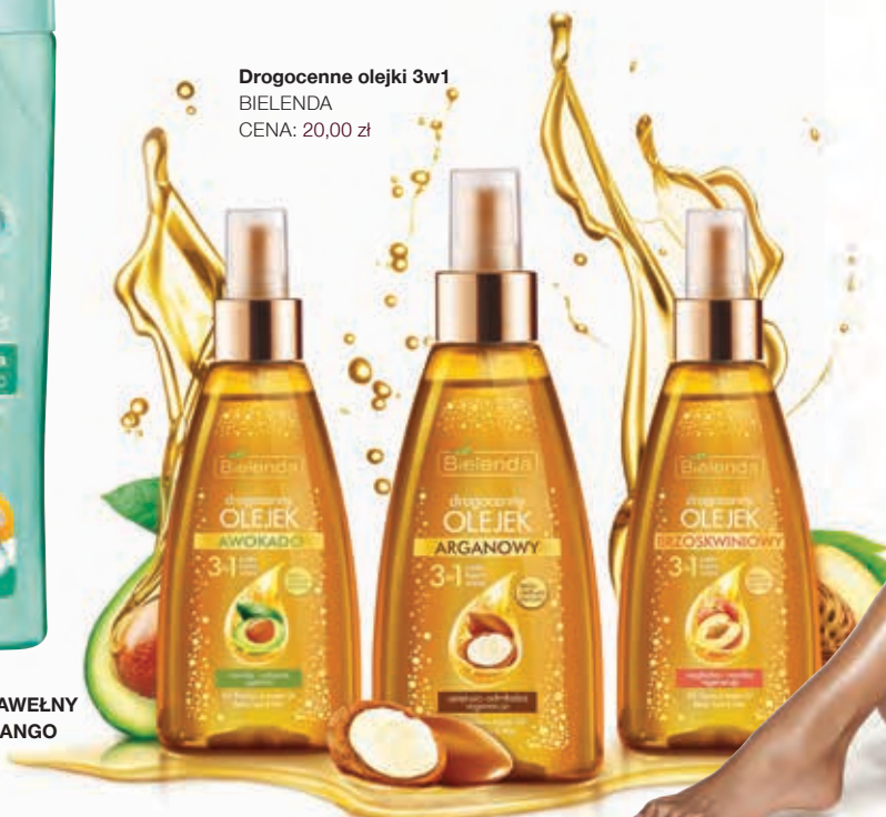
Drogocenne olejki 3w1 BIELENDI CENA: 20,00 zł