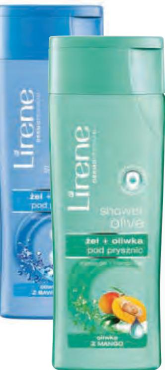
Żel + oliwka pod prysznic z BAWELNY Żel + oliwka pod prysznic z MANGO LIRENE, CENA: 7,99 zł

Najlepsze rozwiązania to zawsze te najprostsze. A są nimi produkty wielofunkcyjne. Takimi są właśnie olejki pielęgnacyjne, które możemy stosować do twarzy, włosów i całego ciała bądź produkty z dodatkiem olejków bądź oliwki. Ich szerokie zastosowanie, lekka formuła i łatwy sposób aplikacji, sprawiają, że są wygodne w stosowaniu. Olejki i oliwki przede wszystkim są doskonałym sposobem na nawilżenie i wygładzenie skóry, a dodatkowo ją ujędrniają.