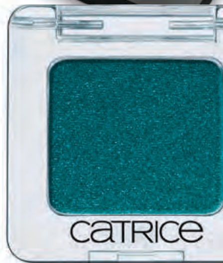
Cień do powiek Absolute Eye Colour Mono Eyeshadow, CATRICE CENA: 11,99 zł