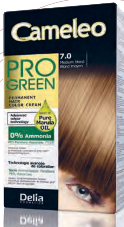
Cameleo ProGreen DELIA